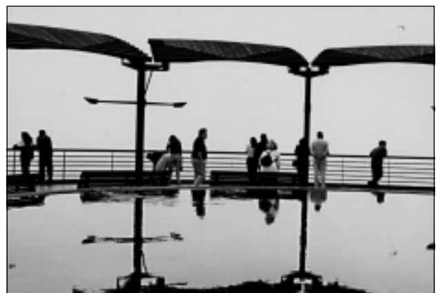
5 pav. Viešoji erdvė. Ramiojo vandenyno parkas Limoje (Peru).