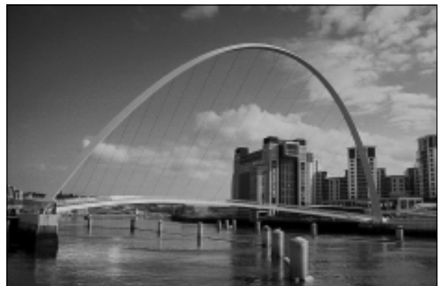
2 pav. Viešosios erdvės architektūra. Niukaslio-Geitshedo Tūkstantmečio tiltas (Didžioji Britanija).

Vakarų Europos kultūrinių industrijų atstovai kalba apie naują ekonomiką, keičiančią paslaugų ekonomiką, kuri iš esmės grindžiama kūrybiškumu [2]. Ryškiausias pavyzdys – Didžioji Britanija, vykdanči grandiozines miestų regeneracijos programas, aktyvinančias vietas bendruomenės ir kultūros sektorių, skatinančias verslą regione ir pritraukiančias užsienio kapitalą, atgaivinančias išstisus miestų kvartalus ir kuriančias naujus tarptautinės reikšmės kultūros centrus [3]. Niukaslis ir Roterhamas, Glazgas ir Kardifas, Birmingemas ir Belfastas – tai tik mažoji dalis miestų ir regionų, kuriuose vykdoma ši programa (2 pav.). Ji apima strateginį planavimą, miestų ir regionų pagrindinių planų rengimą, dizainą (plačiąja prasme), aplinkos inžineriją, bendruomenės, socialinę ir ekonominę plėtrą. Urbanistikai tenka išskirtinė vieta. Didžiosios Britanijos pavyzdžiu urbanistika, kaip ir architektūra, priskiriama kū-