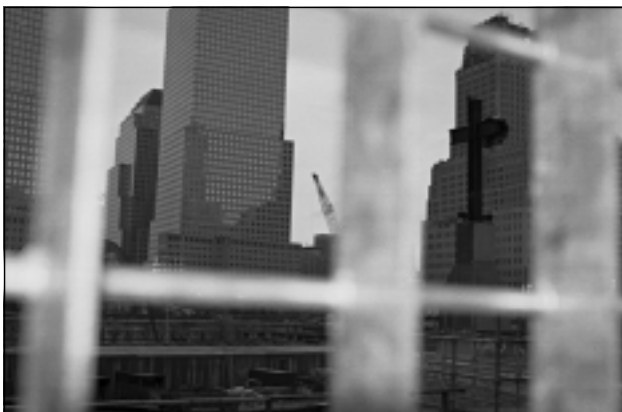
1 pav. Kolektyvinė patirtis ir viešosios erdvės. Manheteno dvynių duobė ir memorialas Rugsėjo 11-osios aukoms atminti (JAV).

Aprioriškai kultūrinę funkciją (KF) suvoktumėme kaip trivalentį vietos, objekto ir reiškinių kontūrą, pasireiškiantį urbanistinėje struktūroje dvejopai: kaip antropogeninių veiksmų tankį (urbanistinės struktūros tapatumas kultūriniam sluoksniui) ir kaip ypatingą morfologinį faktorių (urbanistinės struktūros arba tam tikrų jos elementų tapatumas kultūros reiškiniui arba veiksmui bei materialiai kultūros vystymosi ar reproduktivumosi aplinkai). Šie conceptualūs lygmenys ir suponuotų tolesnę mūsų temos plėtotę, kuriai atsiskleisti padėtų tam tikrų probleminių mazgų lokalizacija.