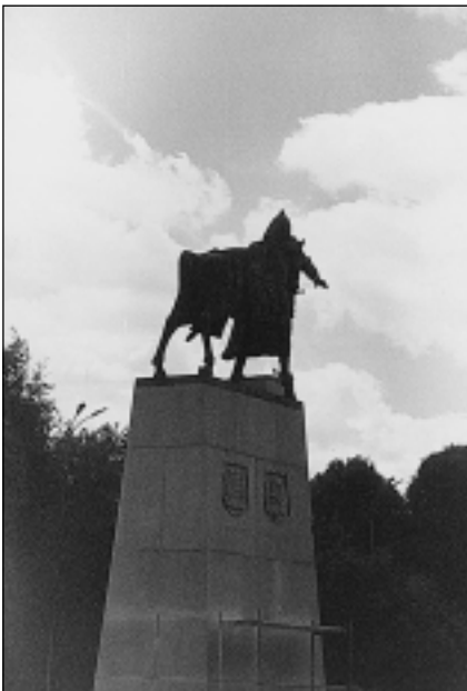
6 pav. Viešosios erdvės. Paminklas Gediminui Vilniaus Katedros aikštėje.

Svarbu ne tai, ar konkretus urbanistinės struktūros elementas atlieka kultūrinę funkciją, ar ne. Aktualus klausimas būtų toks: ar įmanoma miesto regeneracija pasitelkiant kultūros planavimo strategijas, panaudojant vietos kūrybines industrijas, kultūros paveldą ir aplinkos kultūros išteklius. Kitaip sakant, ar kultūrinė funkcija yra pajėgi užtikrinti urbanistinės struktūros išskirtinumą ir kokybę. Mūsų nuomone, visas prielaidas plėtoti ir skatinti kultūrinę miesto