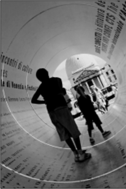
3 pav. Erdvės išplėtimas. Venecijos bienalės reklaminis vamzdis (Italija).

Fig 3. Space expansion. Venice Biennial Promo Pipe (Italy).